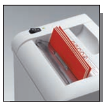
Volet de sécurité

Coupe fibres 4 mm Niveau de sécurité DIN 2 Documents internes.