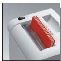
Volet de sécurité

Coupe croisée 3 x 25 mm Niveau de sécurité DIN 3 Documents confidentiels.